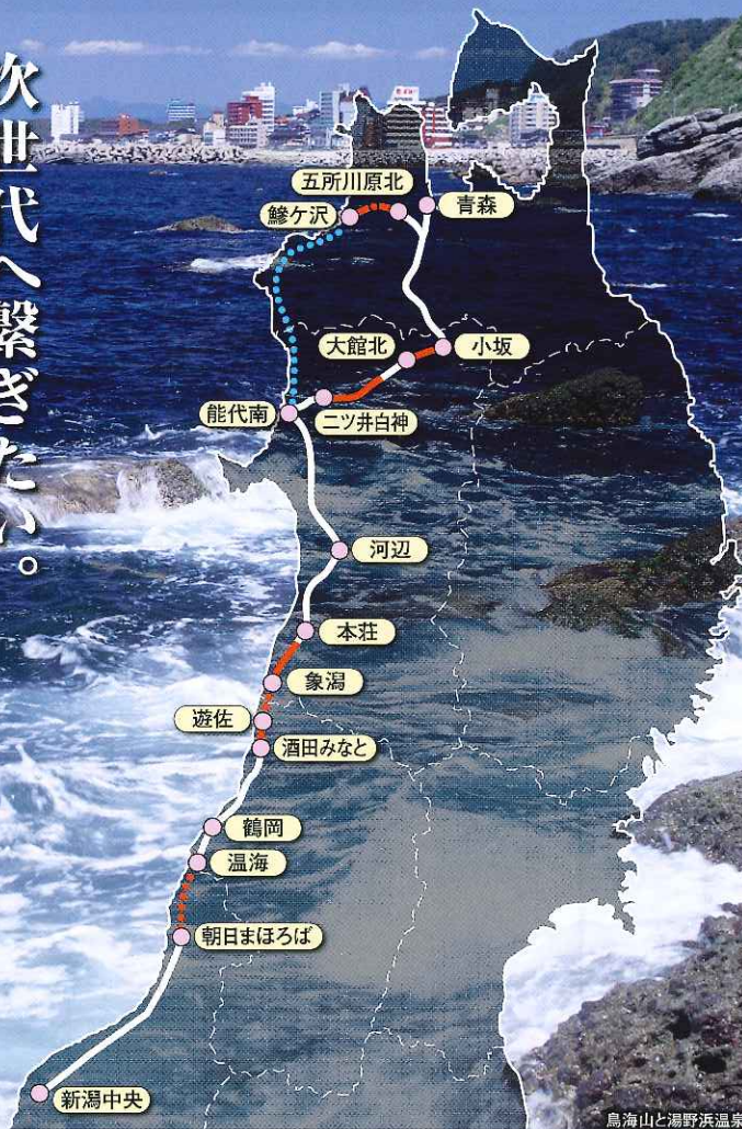
鳥海山と湯野浜温泉