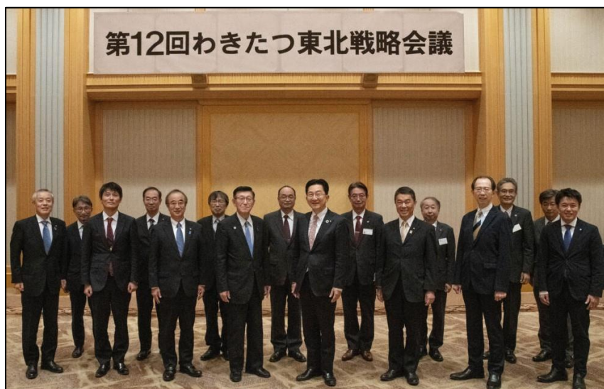
第12回「わきたつ東北戦略会議」