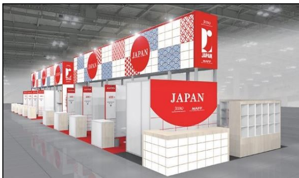
ジャパンパビリオン全体イメージ