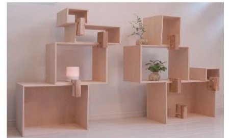
「e・Wood+」は、デザイン性の高いインテリア商品等への応用が期待されています