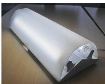
開発に成功した鉄道車両用の 電照カバーの試作品