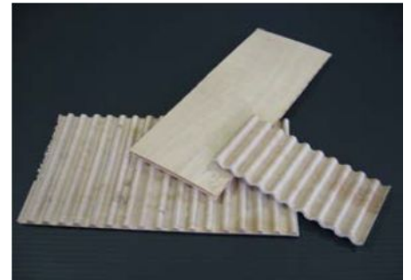
波形状の木質新素材「e・Wood+」