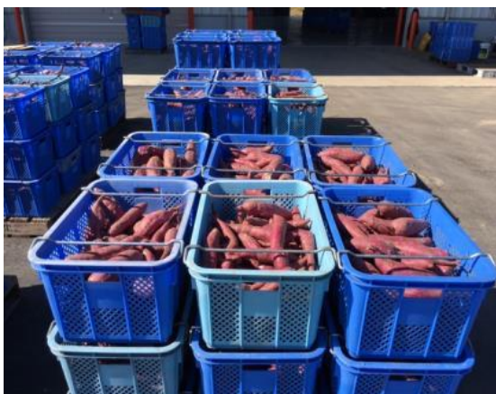
<輸出されるサツマイモ>