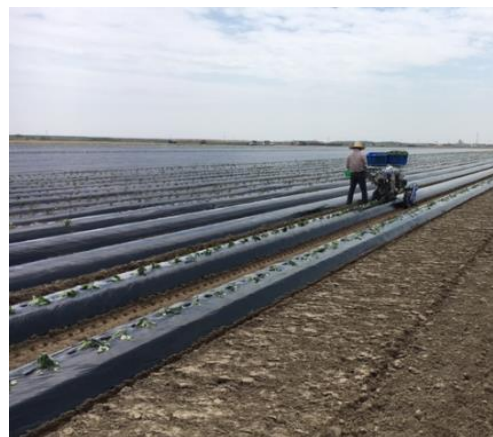
<サツマイモ苗の植え付け作業風景>

【ご照会先】（一社）東北経済連合会 交流政策グループ 野中 電話 022 - 397 - 6528