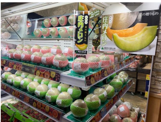
写真：＜イオン香港スーパーでの陳列の様子＞