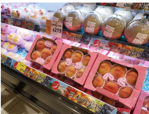
写真：＜イオン香港スーパーでの陳列の様子＞