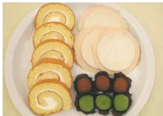
④「もち姫」を利用した加工品