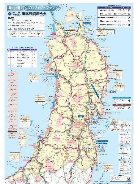
【サイズ 728 × 1030mm】

東日本大震災からの復興を目的に、環境省が掲げる「グリーン復興プロジェクト」の一環として整備された「みちのく潮風トレイル」を新たに掲載しました。本トレイルは、青森県八戸市から福島県相馬市まで約1,000kmに及ぶ、日本を代表する「ナショナルトレイル」であり、被災地の自然、暮らし、そして復興の歩みを「歩いて体験できる復興の象徴的ルート」となっています。