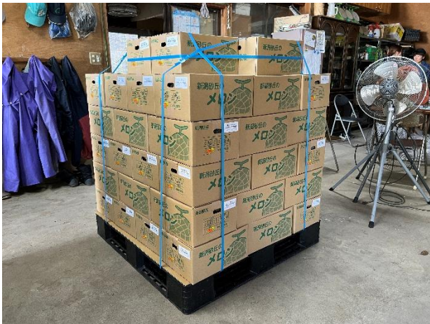
トラックに積込む前の状態