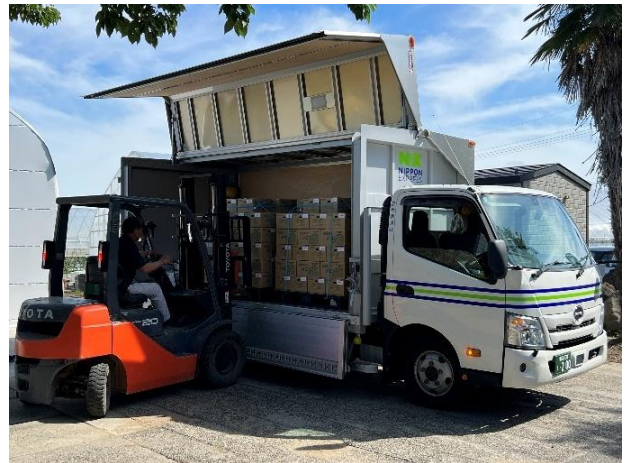
トラックへの積み込み